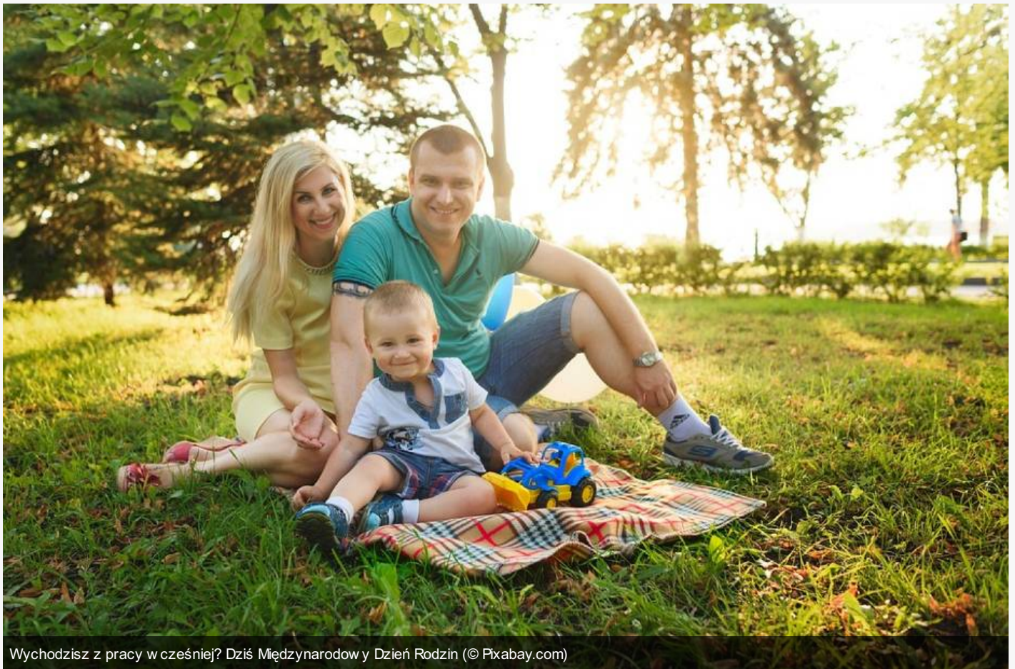
Wychodzisz z pracy w cześniej? Dziś Międzynarodow y Dzień Rodzin

Pracownicy tysięcy polskich firm wyjdą dziś do domu wcześniej o 2 godziny. Akcja “Dwie godziny dla rodziny” ma pomóc budować trwałe rodzinne więzi.